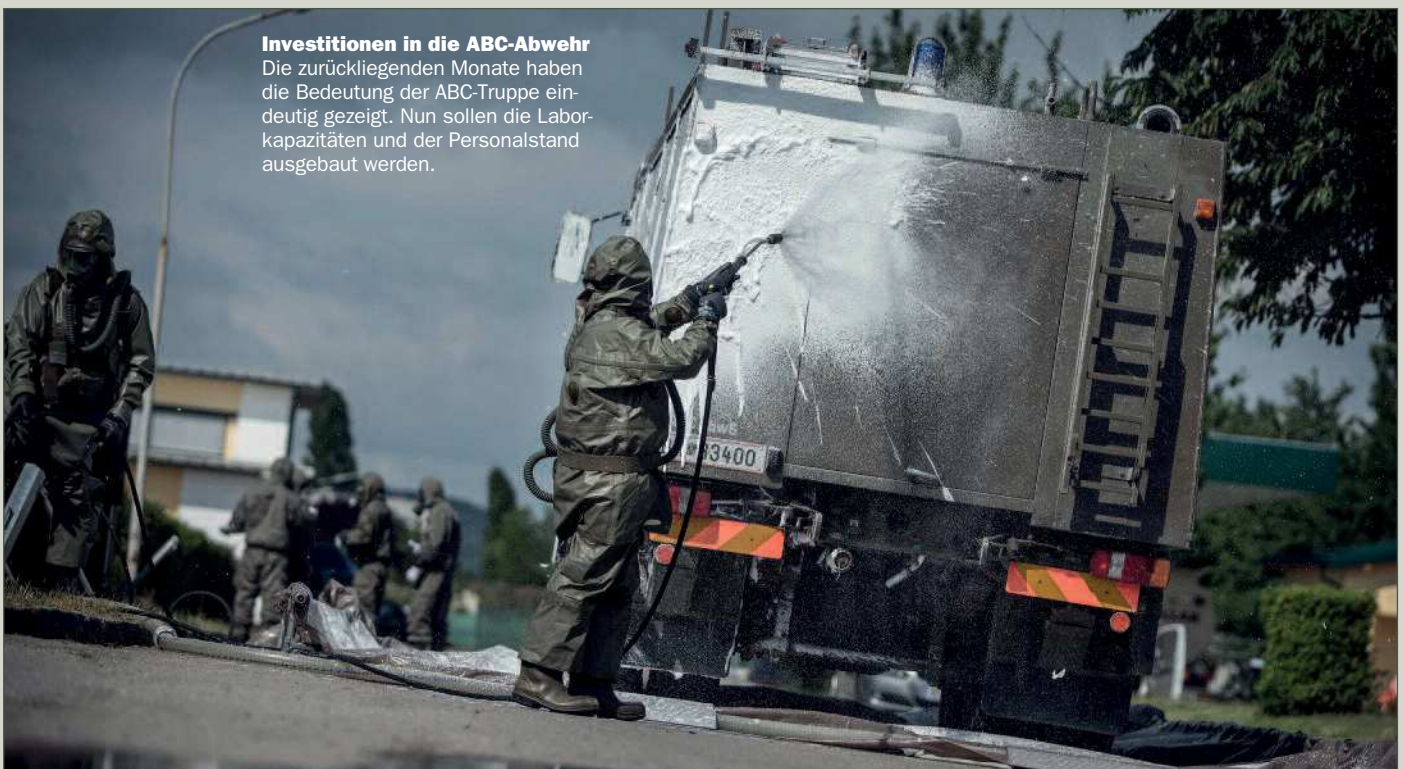
Investitionen in die ABC-Abwehr Die zurückliegenden Monate haben die Bedeutung der ABC-Truppe eindeutig gezeigt. Nun sollen die Laborkapazitäten und der Personalstand ausgebaut werden.

Einer der neuen Schwerpunkte des Heeres soll dem Leitfaden zufolge auf dem immer wichtiger werdenden Bereich Cyber Defence liegen, also der Verteidigung im virtuellen Raum. Dazu wird gemeinsam mit dem Bundeskanzleramt und dem Innenministerium ein Cybersicherheitszentrum auf dem neuesten Stand der Technik geschaffen. Die Ministerin plant hier eine massive Personalaufstockung von 20 auf 250 Personen durch Umschichtung von Planstel-